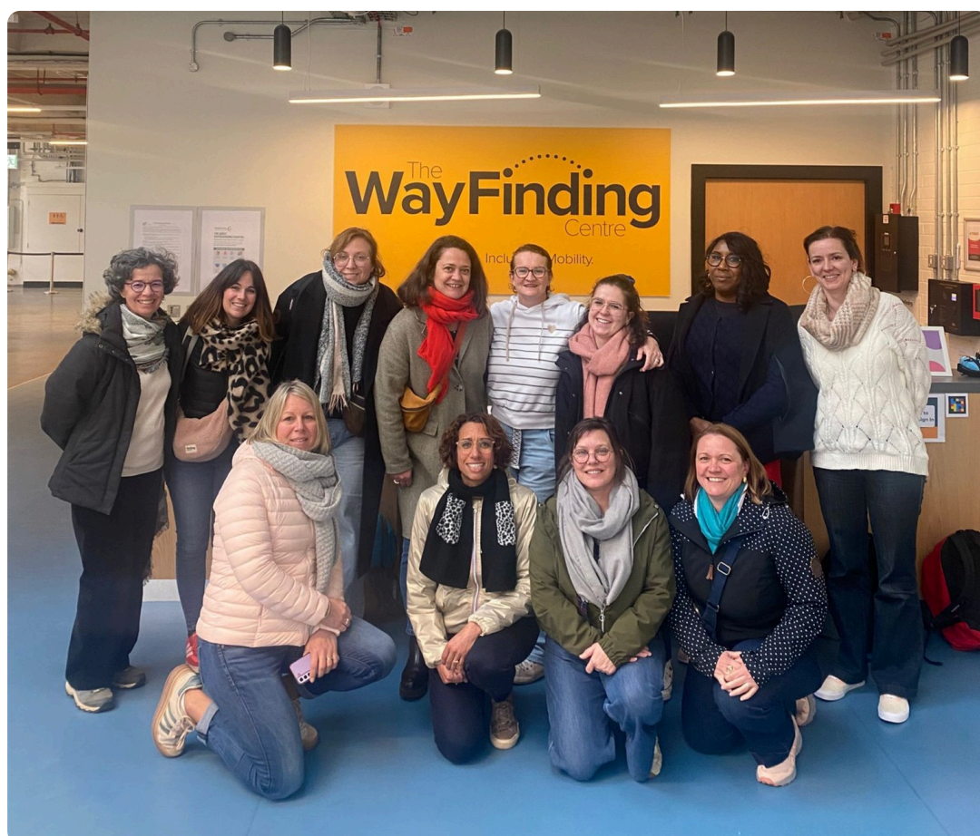
Les PEP AuRA en Irlande

Merci à tous de votre participation et à l'année prochaine !