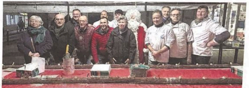
Lancement officiel de la vente en présence du père Noël !

Les professionnels ont travaillé ensemble pour réaliser une bûche de Noël de 48 m vendue au profit de l'IME (Institut médico-éducatif). Elle a été distribuée en parts avec au service la participation des éducatrices de l'IME très émue par cette générosité qui va permettre d'améliorer l'accueil des enfants.