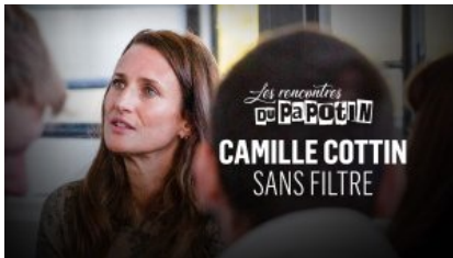
Camille Cottin Comédienne

Retour sur les derniers numéros des “Rencontres du Papotin” :