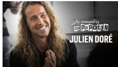
Julien Doré Auteur-compositeur, interprète