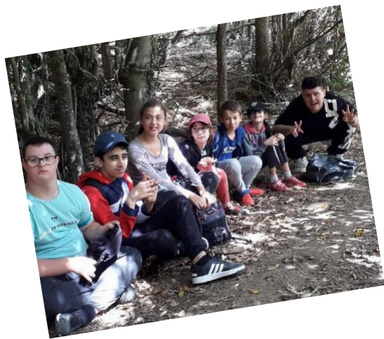
Groupe Galaxie : Activité sportive