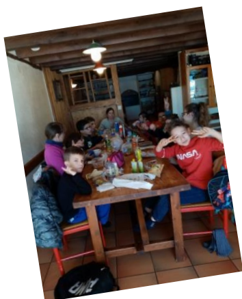
Groupe Etoile : Projet « Petit à petit on devient grand »